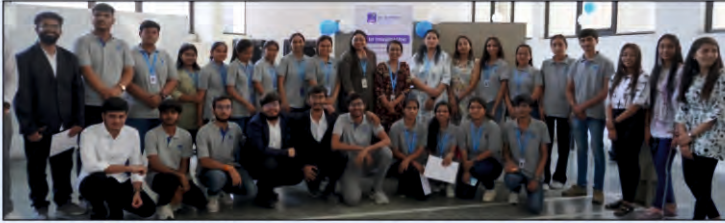
સિટી કવરેજ ટીમ ફિફ્ટલ citycoverage.in

તાજેતરમાં જૂનાગઢની ડૉ. સુભાષ યુનિવર્સિટી ખાતે સ્કુલ ઓફ ફાર્મસી દ્વારા ઈન્ક ટુ ઈમેજનેશન - પેપર રાઈટીંગ સ્પર્ધા યોજાઈ હતી. આ કાર્યક્રમમાં ડૉ. સુભાષ