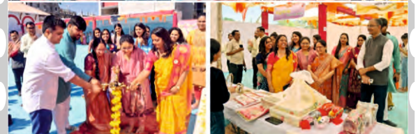
સિટી કવરેજ ટીમ ફિફ્ટલ citycoverage.in

ડૉ. સુભાષ યુનિવર્સિટી ખાતે સહિત 'યુથ ડેવલપમેન્ટ સેલ' દ્વારા જૂનાગઢમાં એ.જી. સ્કુલ ઓફ ફાર્મસી દ્વારા 7 થી 9 માર્ચ 2025 રોમ્પિયન આંતરરાષ્ટ્રીય મહિલા દિવસના અવસરે એક વિશાળ ટ્રેડ એક્ઝિબિશન “ઉડાન” તેમજ મહિલાઓ માટે નિઃશુલ્ક મેડિકલ ચેકઅપ કેમ્પનું આયોજન કરવામાં આવ્યું છે જેમાં